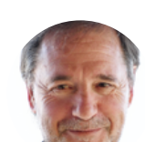
Pasqual Llongueras Embajadora ESP