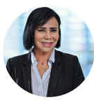
Nadia Eid Nacional Seguros